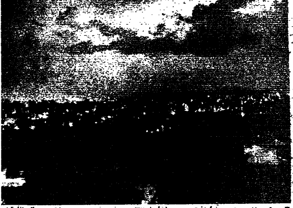
برق ورمح وسحب سوداء توقيحوت مساء امس

« هذا هو اليوم الثالث للهجمة الجيشية ويبدو انه يوم مبارك... سمير جويلا... سمير جويلا... سمير جويلا... »